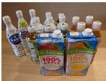
小樽市ひとり親の会様