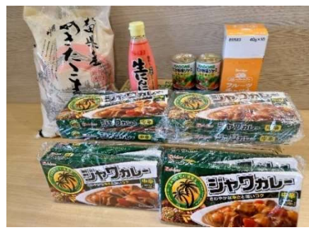
Amazon みんなで応援プログラム