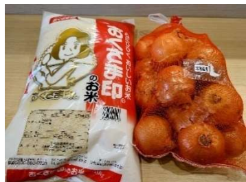
小樽市ひとり親の会様