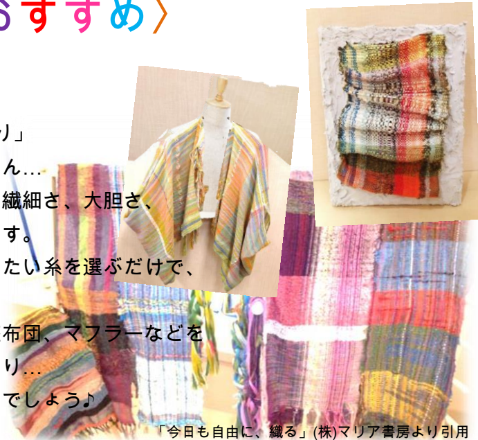
「今日も自由に、織る」(株)マリア書房より引用