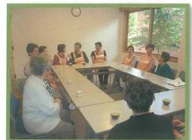
婦人部会～和気あいあいの会合～