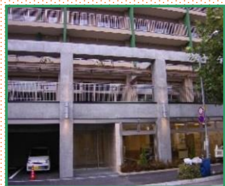
地下鉄南北線「北18条駅」下車 ウィスティアN17(1Fにて営業中)